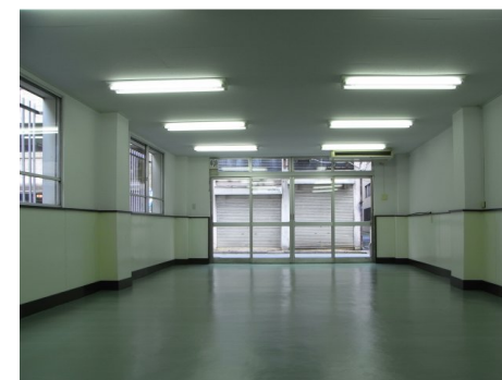
大栄ビル1階 室内 物件番号:36616280001 取引態様:★専任媒介