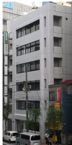
秋葉原花岡ビル外観