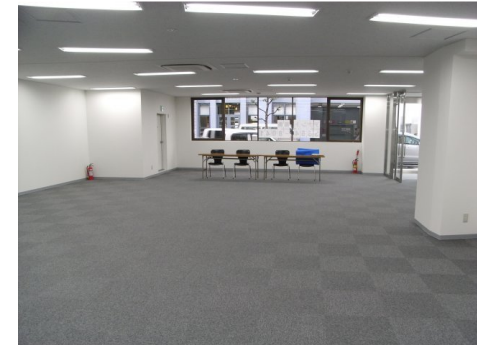
秋葉原花岡ビル 1階室内 物件番号:36895107001 取引態様:★媒介