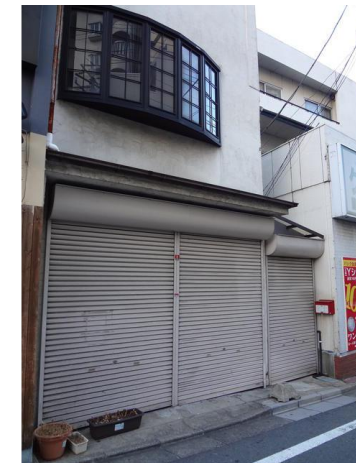
元町丸文外観 物件番号:69502411021 取引態様:★専任媒介